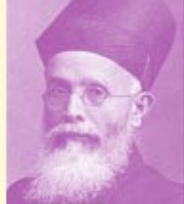
അപ്നീബേട്ടി അപ്യാൻ..... 14