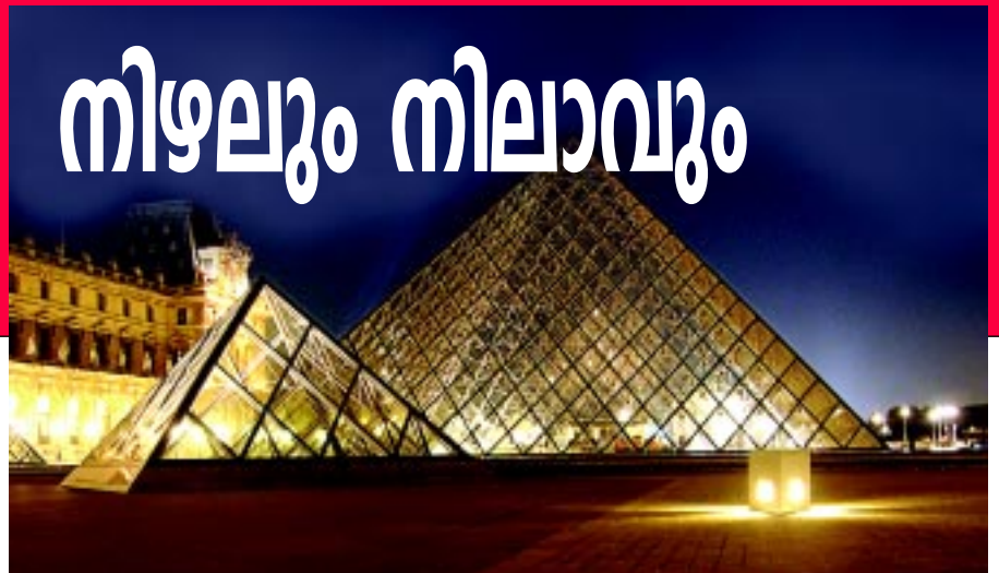
മ്യൂസിയങ്ങളുടെ മാതാവ്: ലൂവ്ര് മ്യൂസിയം