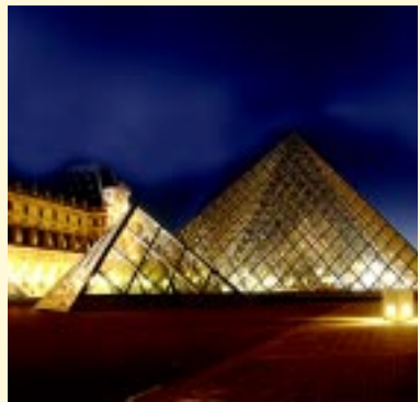
ഫ്രാൻസ് നിഴലും നിലാവു..... 12