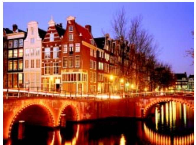
ആംസ്റ്റർഡാം - യൂറോപ്പിന്റെ മാന്ത്രിക നഗരം

◆ എന്നാൽ 1652-1713 കാലഘട്ടത്തിൽ ബ്രിട്ടനും, ഫ്രാൻസുമായുള്ള പരസ്പരമുള്ള തുടർച്ചയായ യുദ്ധങ്ങൾ നെദർലൻഡ്സിനെ അപചയത്തിലേക്ക് നയിച്ചു. 1784ലെ യുദ്ധത്തിൽ ബ്രിട്ടൺ നെദർലൻഡ്സിനെ തികച്ചും തകർത്തു. 1795-ൽ ഫ്രാൻസ് നെദർലൻഡ്സ് കൈയടക്കിയെങ്കിലും, നെപ്പോളിയന്റെ പതനത്തോടെ 1815-ൽ ബൽജിയം, ലക്സംബർഗ് എന്നീ രാജ്യങ്ങൾ ചേർന്നുകൊണ്ട് നെദർലൻഡ്സ് സ്വാതന്ത്ര്യം പ്രാപിച്ചു. പിന്നീട് 1830ൽ ബൽജിയവും, 1890-ൽ ലക്സംബർഗും സ്വാതന്ത്ര്യം നേടി.