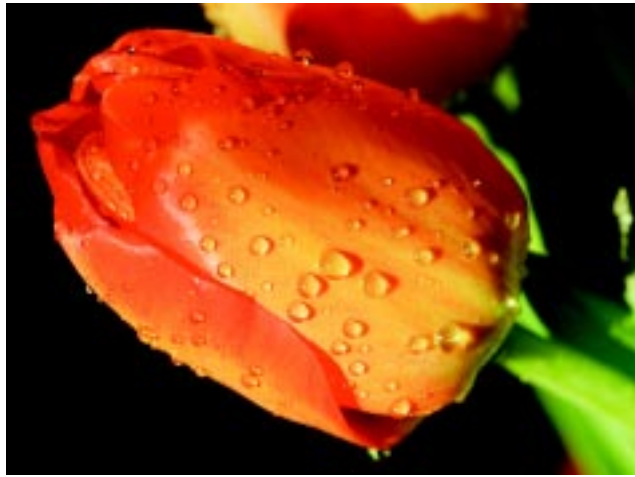
നെദർലൻഡ്സിന്റെ ദേശീയ മുദ്ര-തുലിപ്പ് പുഷ്പം

നെദർലൻഡ്സിലെ 12 പ്രവിശ്യകളിൽ ഒന്നായ ഫ്ളൈവോലൻഡിന് ഭൂമിശാസ്ത്രപരമായ ഒരു പ്രത്യേകതയുണ്ട്. ലോകത്തിലെ ഏറ്റവും വലിയ മനുഷ്യനിർമ്മിത ദ്വീപാണിത്. നെദർലൻഡ്സിലെ അകക്കടലായ സുയിദർ സീ ഭാഗികമായി നികത്തിയും, കടലിൻ്റെ ഭൂമി വീണ്ടെടുത്തുമാണ് ഫ്ളൈവോലൻഡ് ഉണ്ടാക്കിയത്. 1916-ൽ തുടങ്ങിയ പണി 1968-ൽ പൂർത്തിയായി. കരയും, കരയ്ക്കുള്ളിലെ വെള്ളവുമായി ആയിരം ചതുരശ്ര കിലോമീറ്റർ വിസ്തൃതിയുണ്ട് ഫ്ളൈവോലൻഡിന്. ലെലിസ്റ്റൂഡ് ആണ് തലസ്ഥാനം.